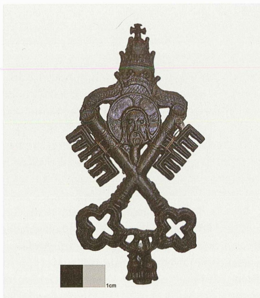
Pilgerzeichen mit Petrus-schlüssel, Tiara und Veracitas-Icon, Rom 1425–1475 (Fundort Brügge)

Immerhin konnte man an den Gräbern der Apostel Petrus und Paulus einen gewaltigen Ablass von 12 000 Jahren erwerben. Zur Blütezeit der Heiltumsfahrt in Aachen zählten Torwächter 1496 am Tag der Kirchweihe 142 000 Pilger bei ca. 20 000 Einwohnern. Nach Wilsnack strömten, so die Überlieferung, jährlich 100 000 Menschen. Anhand dieser Zahlen kann man erahnen, wie viele Menschen im Mittelalter unterwegs zu Wallfahrtsstätten waren. Wallfahrten wurden mit einer gewissen Regelmäßigkeit angetreten. Vermutlich unternahm fast jeder, der es sich leisten konnte, eine Fahrt zu einer Gnadenstätte. Stralsunder Testamente nennen für das 14. Jahrhundert etwa 1,4 Wallfahrten pro Testament, für das 15. Jahrhundert rund zwei